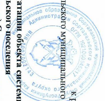
График проведения работ при осуществлении строительства и эксплуатации объекта системы газоснабжения «Газораспределительные сети Кааламского сельского поселения (п. Рютто, п. Кааламо, п. Рускеада, п. Партага, п. Маткаселькя, п. Пуйккола) Сортавальского района. 5-я очередь: Газораспределительные сети п. Маткаселькя»

Сортавальского муниципального района № 1368 от 12.07.2025