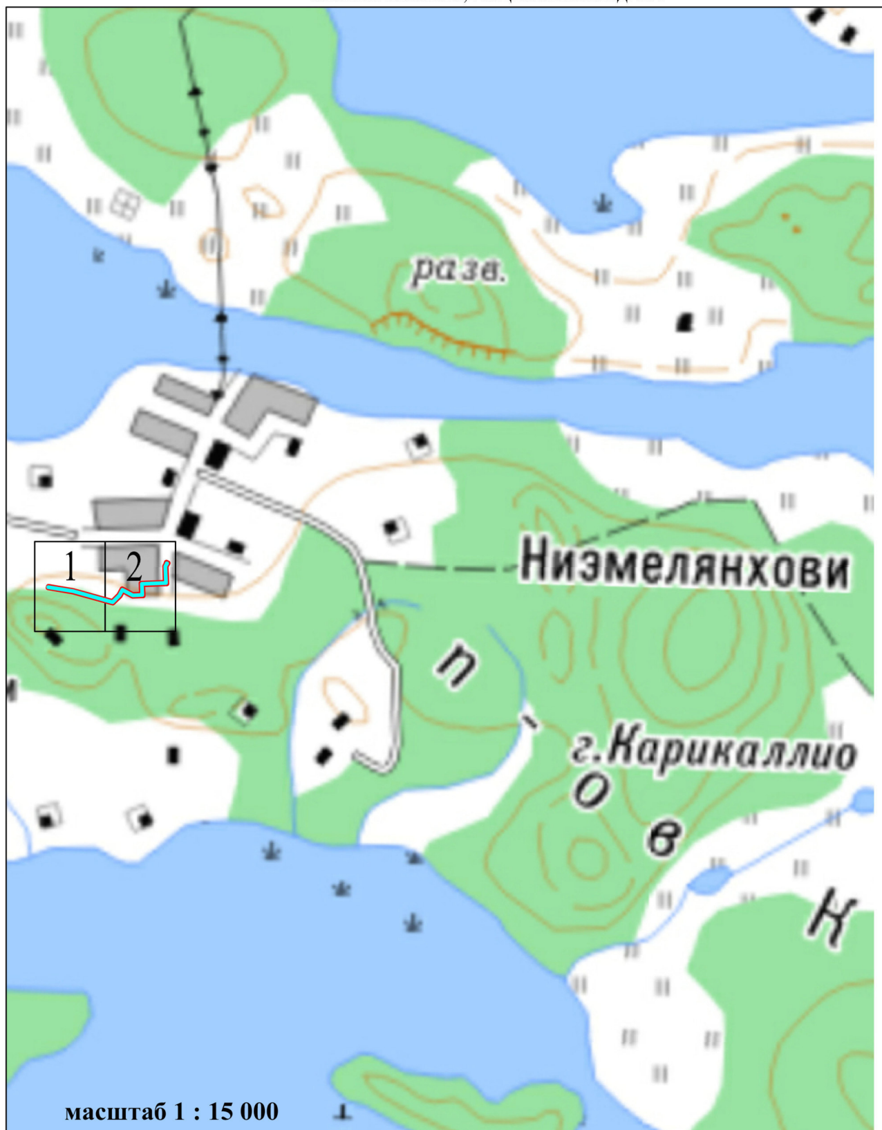
СХЕМА ГРАНИЦ ПУБЛИЧНОГО СЕРВИТУТА П. НИЭМЕЛАНХОВИ, УЛ. ЦЕНТРАЛЬНАЯ Д. 18А