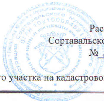
Схема расположения земельного участка на кадастровом плане территории

Утверждена: распоряжением Министерства имущественных и земельных отношений Республики Карелия