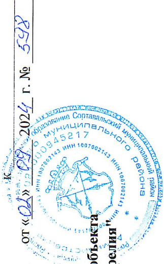
График выполнения работ при осуществлении строительства и эксплуатации линейного объекта "Распределительный газопровод в п.Кааламо, Республика Карелия"