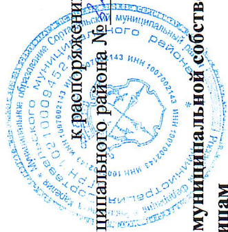
График выполнения работ в отношении земель и земельных участков, находящихся в государственной или муниципальной собственности и не предоставленных гражданам или юридическим лицам

Сортавальского муниципального района № 13 от 13.05.2024.